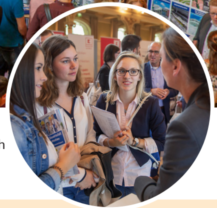
Personalverantwortliche und Studierende im Gespräch

Der Karrieretag Bauwirtschaft in Berlin findet am Donnerstag, den 6. Oktober 2022 im Seminaris CampusHotel in Berlin-Dahlem statt. Wir laden Studierende vom 3. Semester bis zum Abschluss (BA) sowie aus Masterstudiengängen von den folgenden Fachbereichen zum Karrieretag Bauwirtschaft ein: