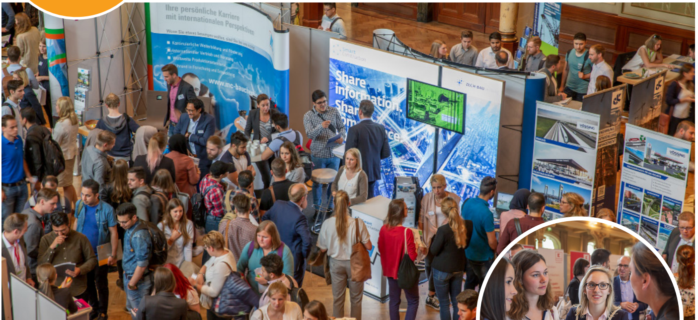
Eindruck vom Karrieretag